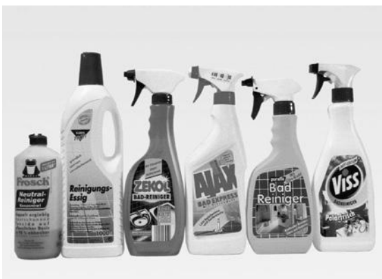
Abbildung 2: Handelsübliche Reiniger

In der Gebrauchsanleitung wird weiterhin darauf hingewiesen, dass eine säurefeste Ausführung der keramischen Fliesen und Sanitärreinbauteile vorliegen muss, was bei einer zementären Verfugung im Privatbereich nicht gegeben ist. Oft fehlt jedoch der Hinweis, dass solche Reiniger nur mit einigem zeitlichen Abstand und nur mit kurzer Einwirkzeit auf Fliesenbelägen mit zementärer Verfugung eingesetzt werden dürfen.